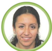
Tania Villa Trapala Directora General del Espectro 2 entrevistas