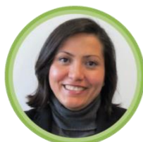
Monserrat Urusquieta Cruz Directora General de concesiones de radiodifusión 1 entrevista